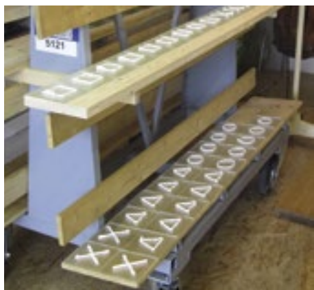
04 Baustoffmuster vor dem Versand an die Testpersonen. Wie diese die Muster prüften, war ihnen freigestellt.

auslösen können, wurden nicht berücksichtigt. Für die Tests wurden die Produkte gemäss den Herstellerangaben zubereitet, auf eine Glasplatte aufgebracht und einen Monat ausgetrocknet (Abb. 04).